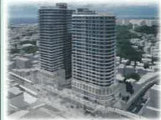
画像は現段階のイメージです。

B地区 ：構造：鉄筋コンクリート造 規模：地上27階建、高さ：約100m その他施設：駐車場、駐輪場、図書館等