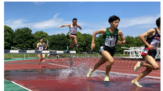
東松山市長距離記録会兼青葉杯 3000mSC(6月3日)東松山陸上競技場