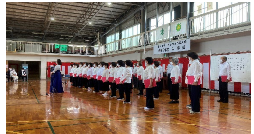
きらめき市民大学21期生入学式 (4月12日)きらめき市民大学