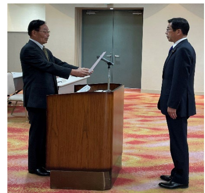
当選証書附与式 (4月24日)総合会館