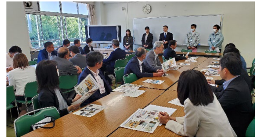
連合埼玉議員会議「県内視察研修会」 (5月24日)蓮田松韻高校