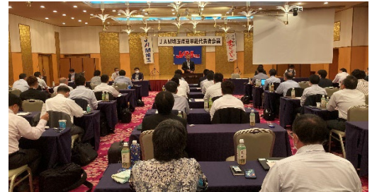
JAM埼玉県連単組代表者会議 (5月28日)渋川市