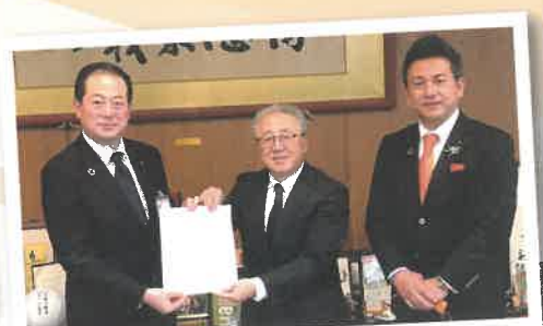
野志松山市長へ松山南ライオンズクラブ 45周年記念事業記念品を贈呈