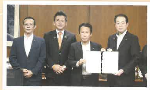
会派フロンティアまつやまで野志市長へ 要望書の提出