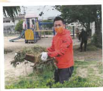
公園周辺清掃ボランティア (2ヶ月に1回開催)