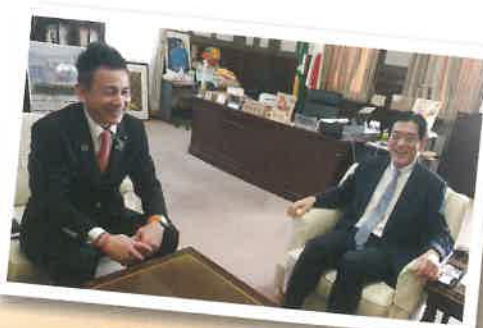
中村愛媛県知事と談笑の一コマ…