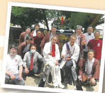
地域の秋祭りで仲間とともに…