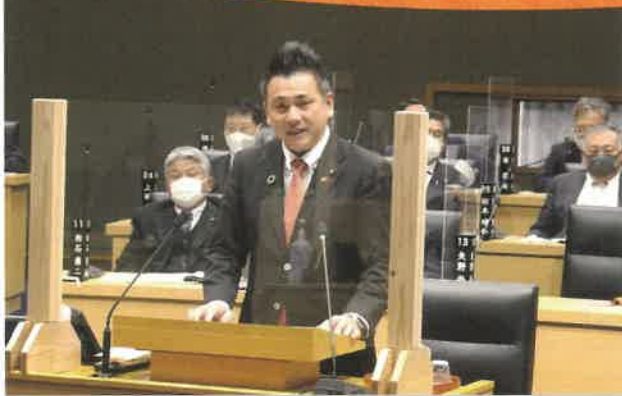
～プロフィール～ 小野小、小野中、東温高校、松山大学法学部卒業 1975年1月24日生(47歳) 2018年4月 松山市議会議員選挙 初当選