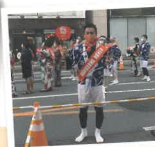
久しぶりの松山まつりに議連で参