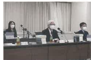
氏名の読み方の基準を定める戸籍法改正などの要綱案を取りまとめた法制審議会戸籍法部会=2日午後、法務省

法制審議会(法相の諮問機関)の戸籍法部会は2日、戸籍に記載されていない氏名の「読み仮名」を必須とし、読み方の基準を定める戸籍法改正などの要綱案を取りまとめた。記載は片仮名。いわゆる「キラキラネーム」など、漢字本来と異なる読み方を認める範囲に一定のルールを設け「氏名に用いる文字の読み方として一般に認められているもの」とした。