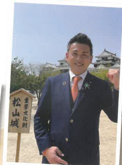
松山のためにこれからも頑張って参ります