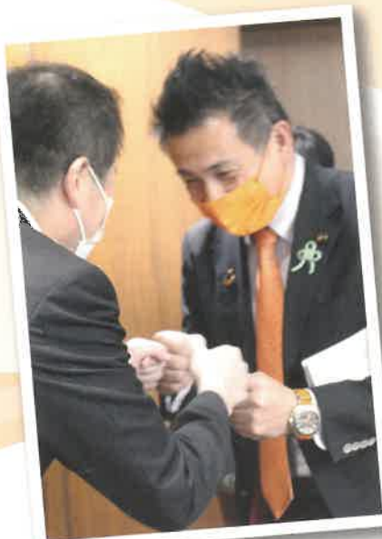
松山市 野志市長とグータッチ!