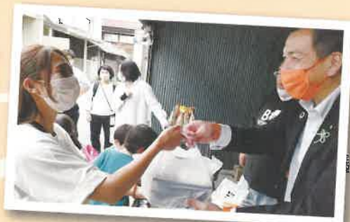
これからも市民の皆さまとのふれあいを 大事にしていきます