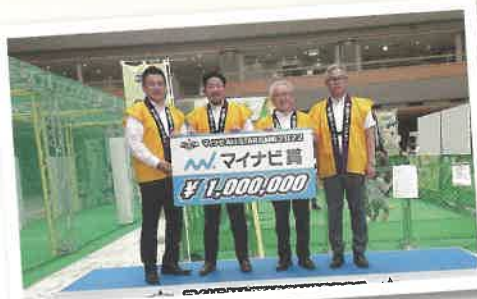
第一副会長を務めさせていただいている 松山南ライオンズクラブ45周年記念事業