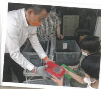
子どもたちへカブトムシのプレゼント