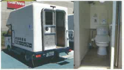
◆今回災害地で評判のトイレカー