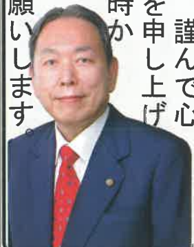
伊関議員からお知らせ

能登半島地震が発災、備えをしよう! ◆新型コロナウイルス感染症の脅威も終わり、4年ぶりに普通の日常が戻りつつありましたが、1月1日、能登半島地震が発生しました。多くの方が被災し、今も避難所で生活をされています。謹んで心からお悔みとお見舞いを申し上げます。三浦半島でも何時かは起こり得ることです。皆様に於かれては日頃の防災の備えをお願いします。