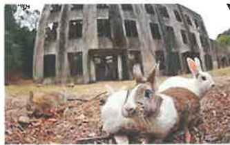
大久野島毒ガス工場跡(竹原) 今は「うさぎの島」観光名所