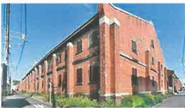
1月重文指定、宇品「陸軍被服支廠」 反戦平和核廃絶に向け活用を

存続を求める「保存を願う会」の運動が国、県、広島市を動かし、「全4棟保存、本年1月の国の重文指定)につながった。さらに多くの被爆建物の保存、広島県内に残されている戦争遺産の保存につなげたい。