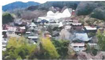
中畑地区の大規模防災工事 「収穫祭」の再開は当分先か