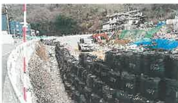
天応大屋大川改修工事進行中 県道の復興工事も同時に進行