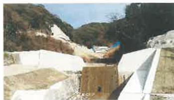
375号広上石内土石流防災工事中 5年前豪雨で375号の橋と下水道流失