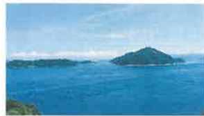
とびしま街道延長を