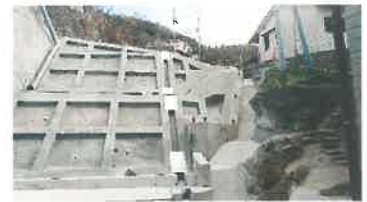
吉浦潭鼓町急傾斜工事完成 上の山地と下の住宅地防災