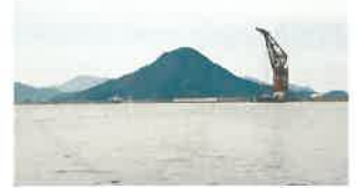
1万人の被爆者救護所、帰還兵の 検疫所、捕虜収容所似島・安芸小富士