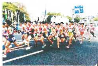
広島全国都道府県男子駅伝