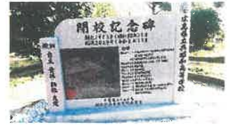
呉市民は反対♥ 呉昭和高校閉校、記念碑