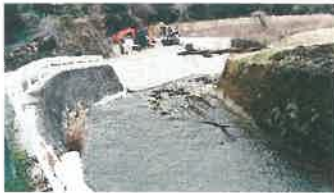
安浦中畑川の部分改良復旧 全区間の完了は当分先か。急いで♥

呉市内の天応、安浦地区でも復旧復興工事が国、広島県、呉市共同で行われていますが、河川や田畑の復旧もこれからです。特に安浦地区の復旧復興が急がれます。