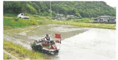
市原地区の田畑の復旧一部進む 田植えも始まっている♥