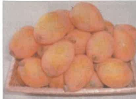
ビワ狩り食べ放題!