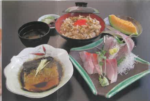
あさり炊き込みご飯!