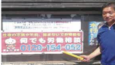
真面目に働く皆さんを応援しています。 仕事の不満や不安、悩まないで 何でも労働相談、電話ください。

吉沼・豊里・高須賀高良田各地域の渋滞緩和 通勤通学道路の安全、緊急・災害避難の対応 要望実現に向け精一杯取り組んで参ります。