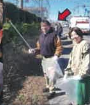
地域のゴミ拾い・草刈を行って気分爽快!