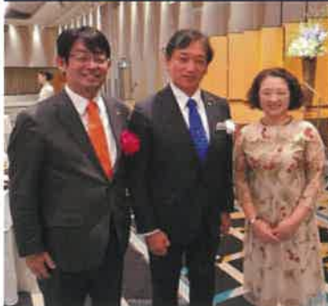
JAM結成25周年記念式典 政策制度実現に取り組めます。 (左)安河内JAM会長 (右)芳野連合会長