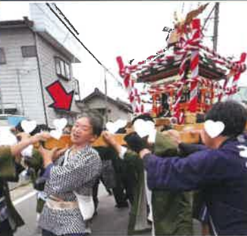
上郷祇園百年祭! 歴史と伝統を大切に 地域が元気に笑顔あふれる